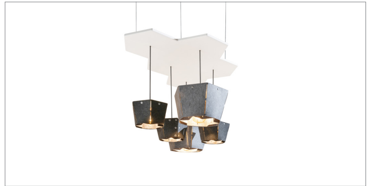
Barnacle Lamp 5-stuks installatie - PWCF-303

De ingenieuze 'Barnacle' lampen zijn geïnspireerd op de kleine schelpdiertjes (zogenoeten zeepokken) die zich vastzetten op de huid van de walvis. De lampenkap is gemaakt van gerecycled PET-vilt. De lampen zijn ideaal voor boven de 'Whale' boardroomtafel. De lampen kunnen in diverse composities worden samengesteld om het gewenste lichteffect te creëren